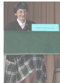
Par Maryse Watier Secrétaire de la Section